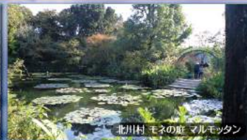
北川村 モネの庭 マルモツタン